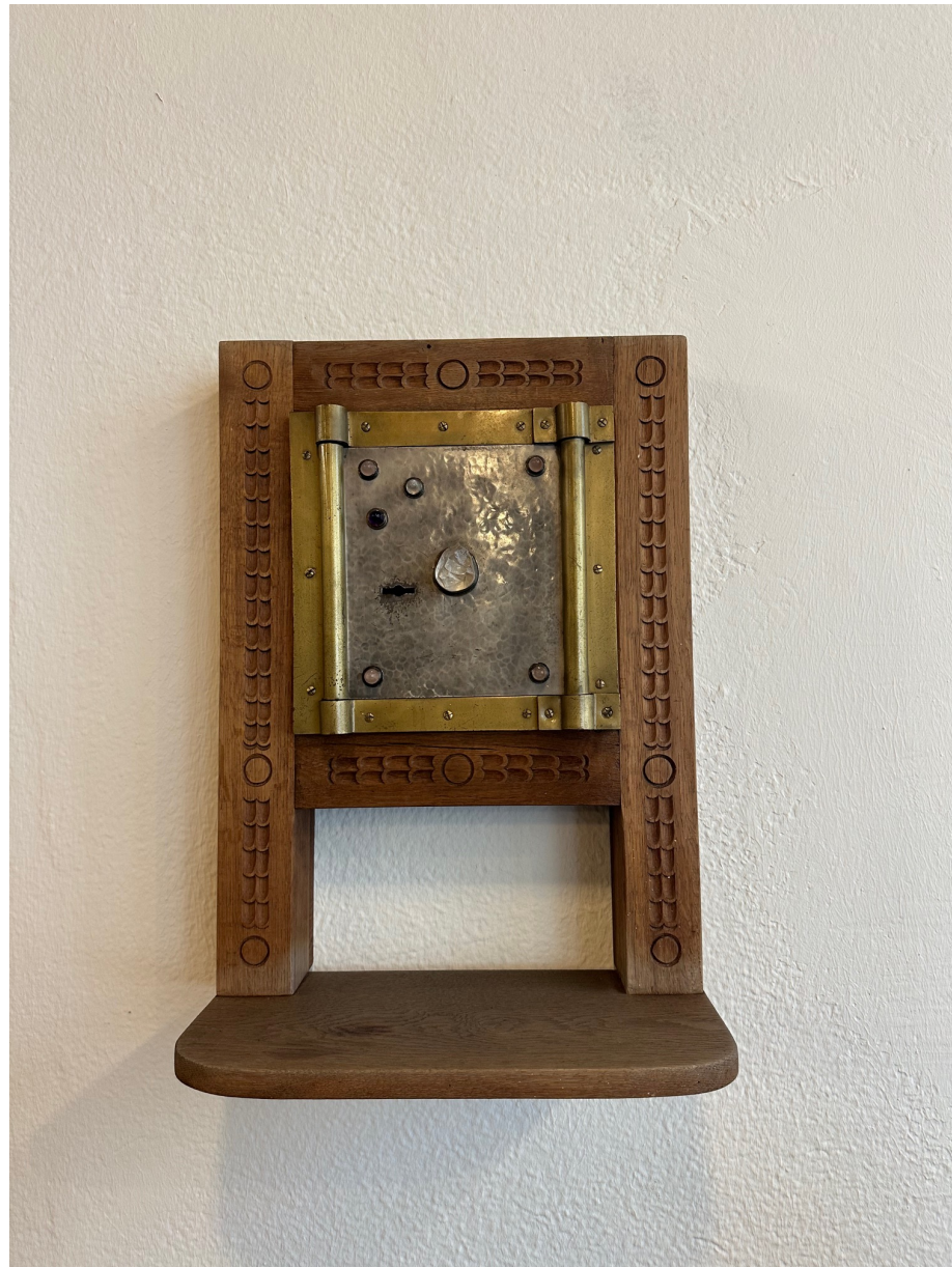
Tabernakeltür an der Chorwand