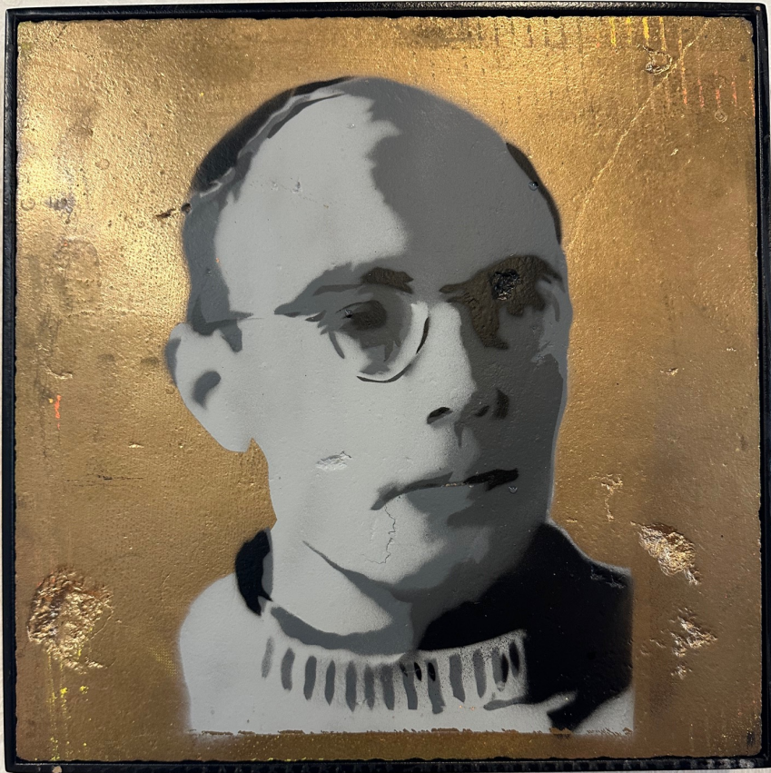
Karl Leisner *1915 (Rees) - + 1945 (Krailing) Martyrer der katholischen Kirche

Sprühportrait des Streetarkünstlers Mika Springwald.