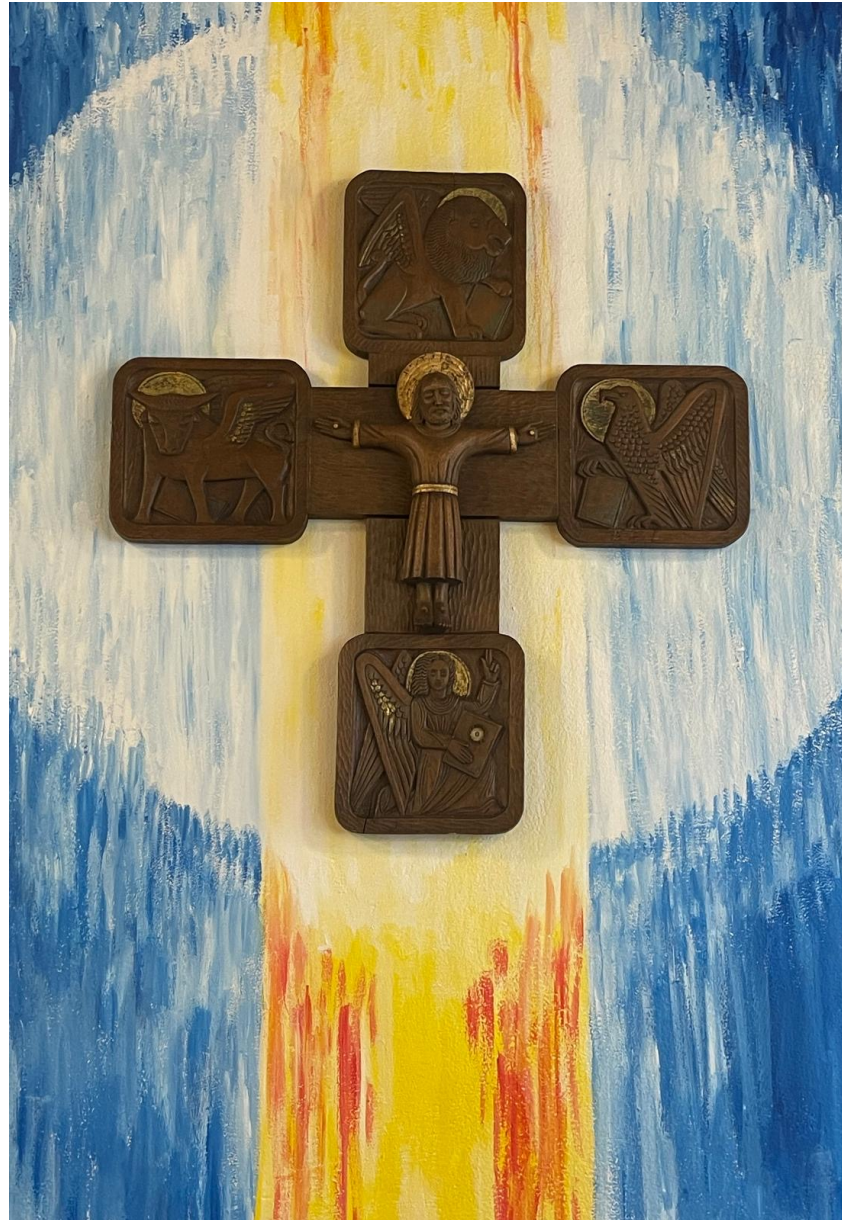
Das alte Kreuz vermutlich aus der Niehler Pfarrkirche